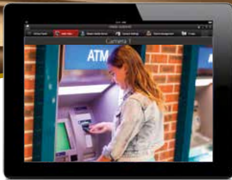
iVMS-5260HD Mobiler Client